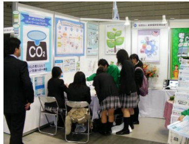
服の一生すごろく体験