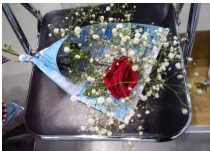
最終日来場者プレゼント