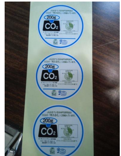
JA みなべいみなみ様シール