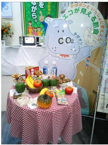
製品サンプル展示