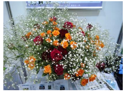
製品サンプル展示