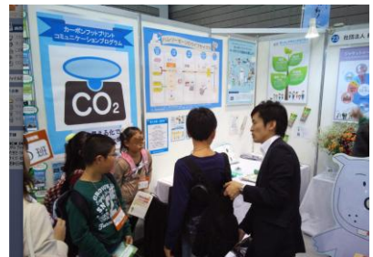
服の一生体験ベスト着用