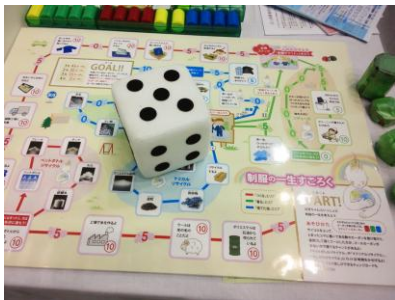
服の一生すごろく