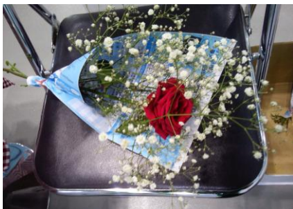
最終日来場者プレゼント