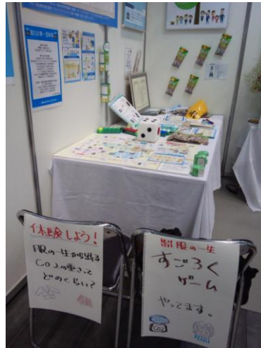
服の一生すごろく案内